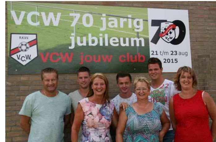
De Jubileumcommissie van V.C.W.

Namens de jubileumcommissie willen wij iedereen bedanken die heeft meegeholpen om dit tot een onvergetelijk weekend te brengen. Tot over 5 jaar!!